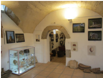
Salle H Marius Maders

En juillet nous avons eu 271 visiteurs, en août : 275 et en septembre : 379!