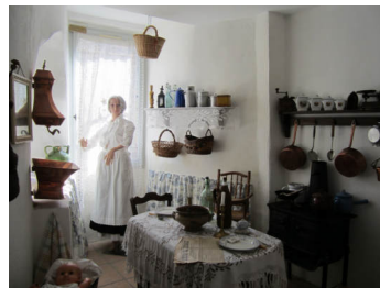
Cuisine début XX ème siècle

La publicité commence à porter ses fruits puisque les personnes viennent découvrir Caux à travers l'espace patrimoine, la visite guidée du village et la montée au clocher.