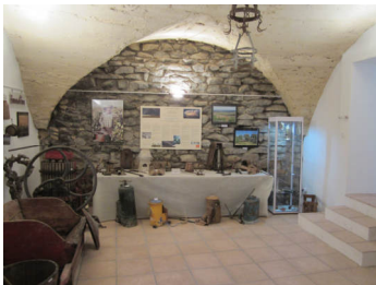
Salle Georges Saurais

Des visites « privées » peuvent être organisées sur demande. Nous contacter par mail ou téléphone.