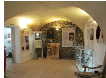
Salle Monique Beugnon