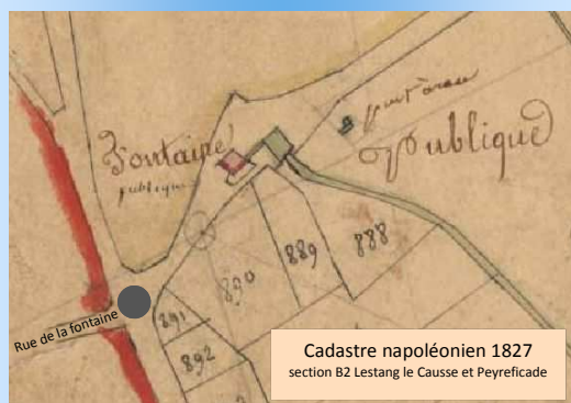
Cadastré napoléonien 1827 section B2 Lestang le Causse et Peyreficade

Au début du XXe siècle, Caux était alimenté par une pompe qui puisait l'eau potable à la source de la Fontaine Loin, près de la cave coopérative.