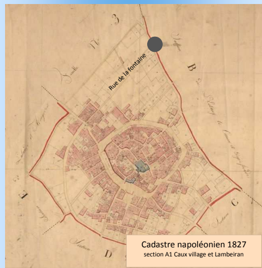
Cadastré napoléonien 1827 section A1 Caux village et Lambeiran