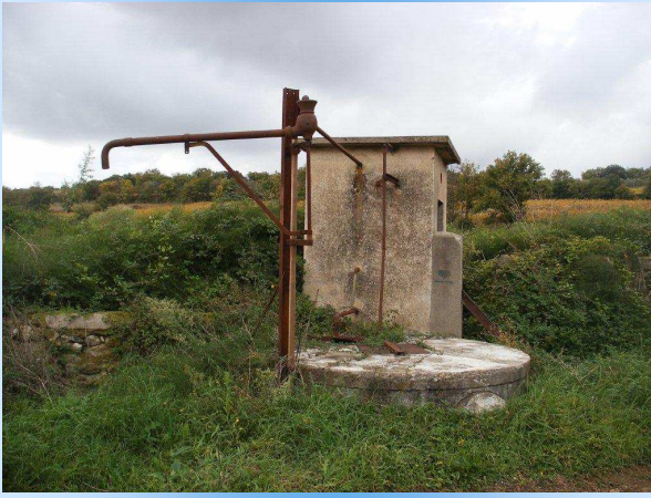
Source de la Font de l'Oum

Cette alimentation supplémentaire en eau restera en fonction jusqu'en 1957, date à laquelle le village a été alimenté par le réseau du Syndicat de la Vallée de l'Hérault. Le réservoir d'eau du château sera détruit.