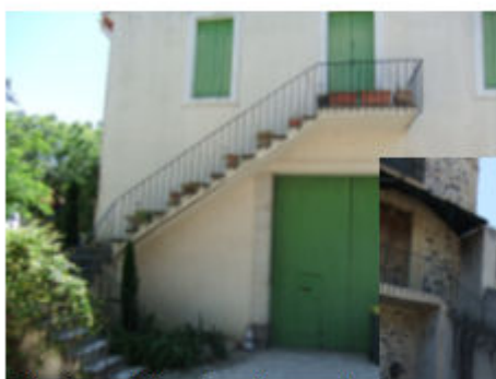
Boulevard Anselme Nougaret