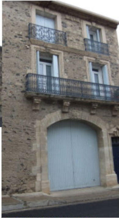
Boulevard Anselme Nougaret