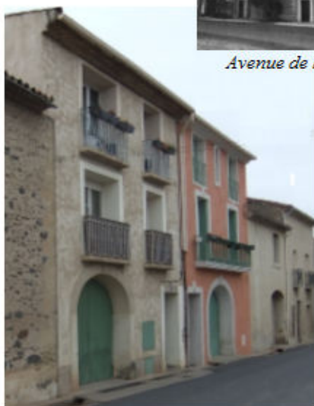
Avenue de Néffiès