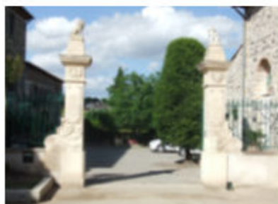
Route de Pézenas