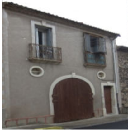
Boulevard Anselme Nougaret