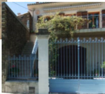
Avenue de la gare