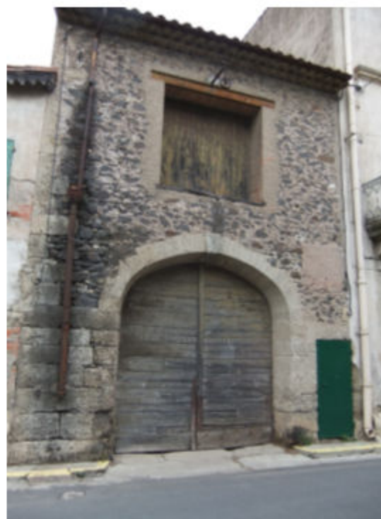
Avenue de Néffiès