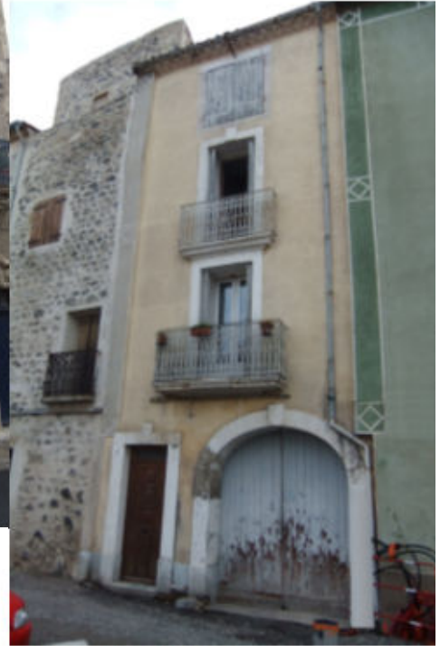
Place de la république