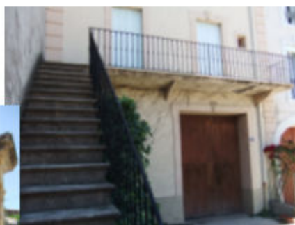
Boulevard Armand Durand