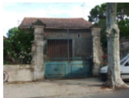
Avenue de la gare