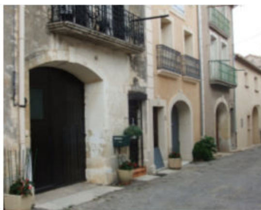
Impasse de l'Aramon