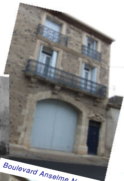
Boulevard Anselme Nougaret