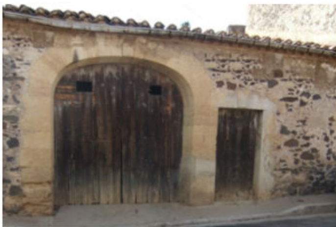
Boulevard Anselme Nougaret