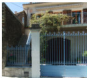
Avenue de la gare