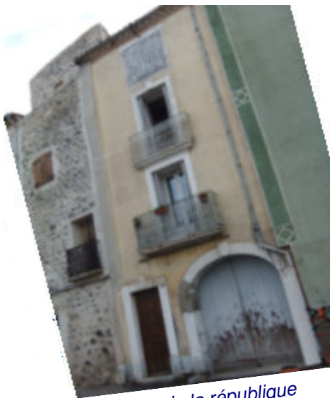
Place de la république