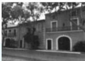
Avenue de la gare