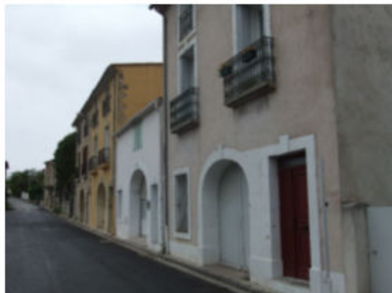
Route de Mougères