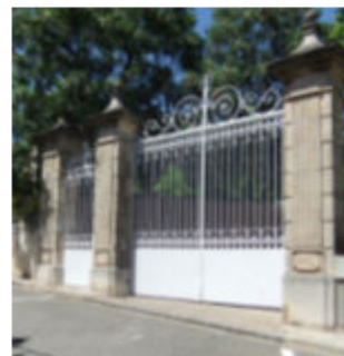
Rue de l'égalité