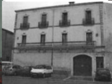
Place du jeu de ballon